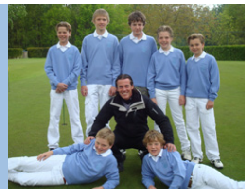
Team Jeugd 3 speelt in de competitie Jeugd Dubbel Negen, poule J122.

Tot slot wens ik jullie een succesvolle competitie en een geweldig golfjaar met veel