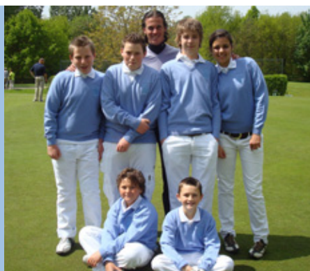
Team Jeugd 2 speelt in de competitie Jeugd Dubbel Negen, poule J110.

Ik hoop van harte dat jullie met mooie sco-