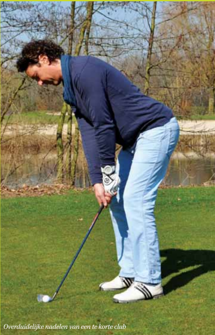
Overduidelijke nadelen van een te korte club