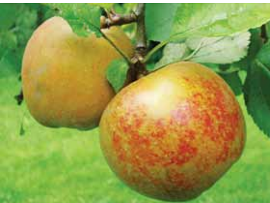
Schone van Boskoop