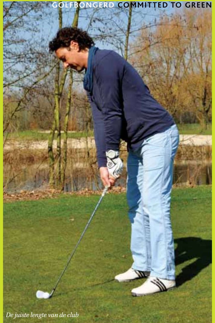
De juiste lengte van de club