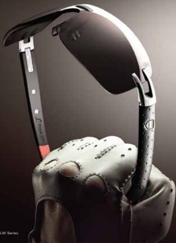
L-TYPE LW Series.